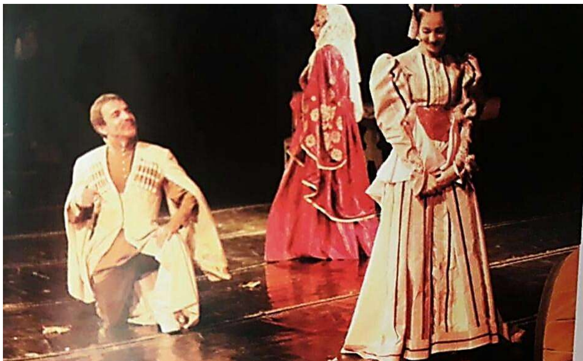
А. Цагарели. «Ханума». Сцена из спектакля.