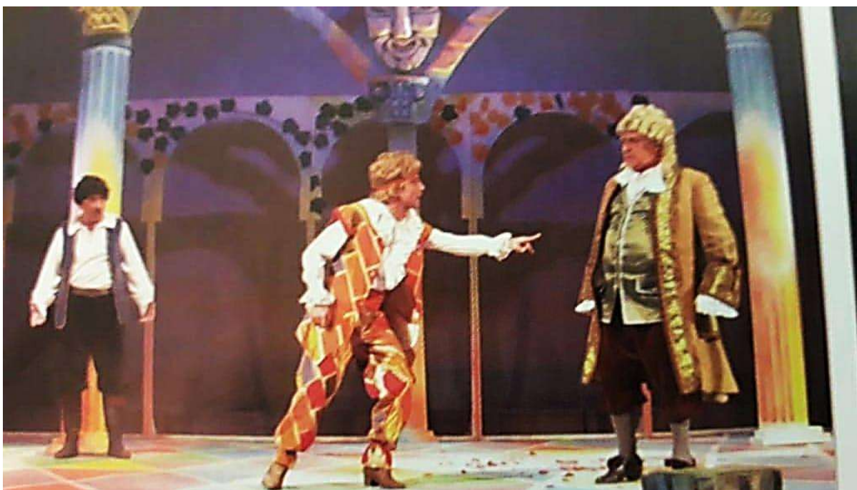
Ж.-Б. Мольер. «Плутни Скапена». Сцена из спектакля.