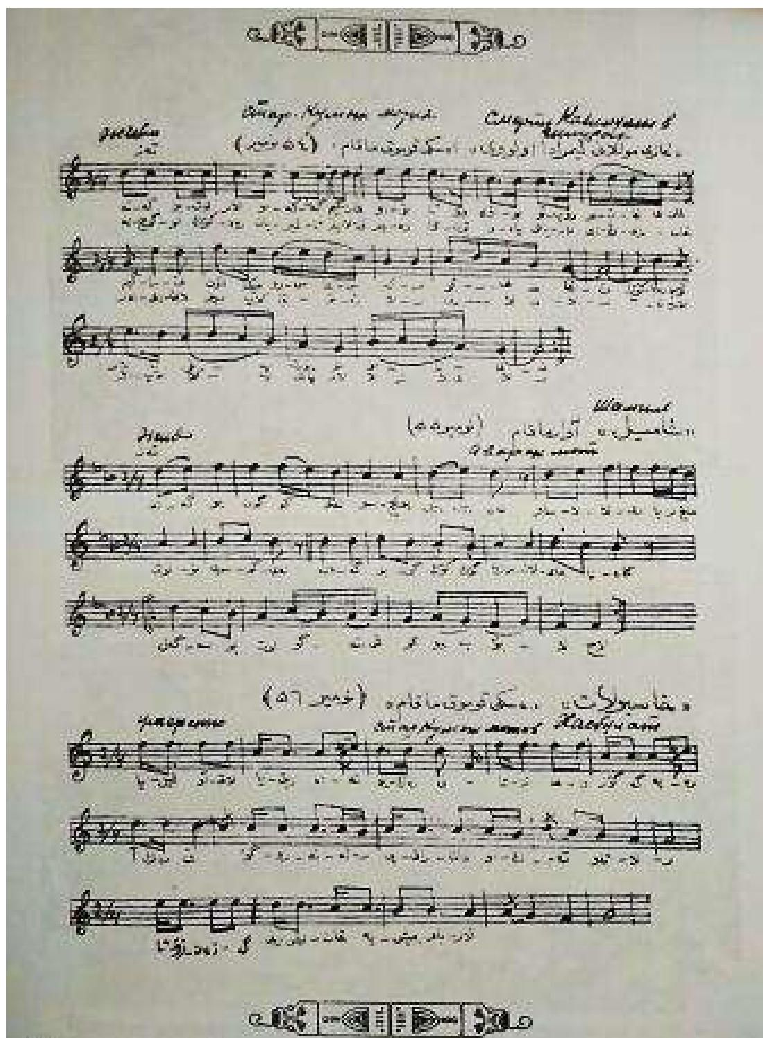
Нотные листы из «Сборника стихов и песен» Т. Бейбулатова, 1926 г.